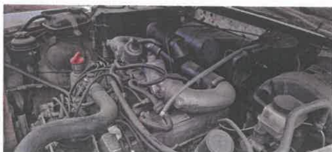
Dok. fot. nr 9