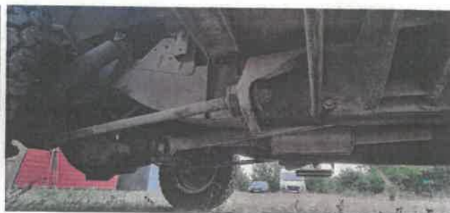
Dok. fot. nr 18