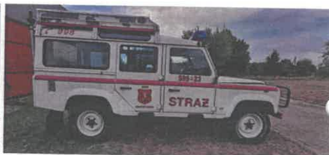
Dok. fot. nr 4