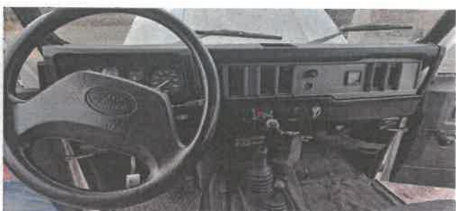
Dok. fot. nr 12