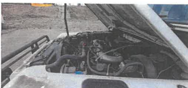
Dok. fot. nr 11