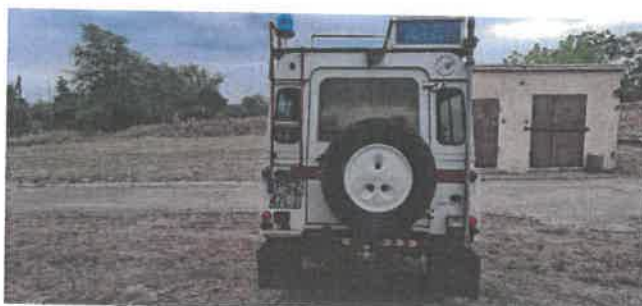
Dok. fot. nr 5