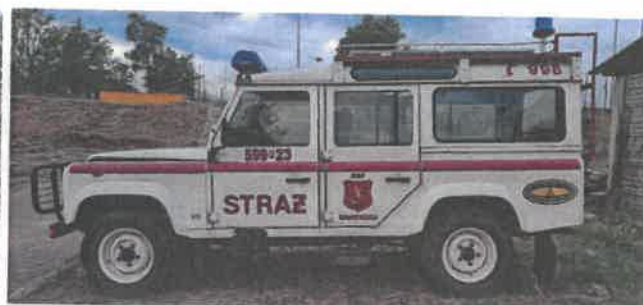
Dok. fot. nr 6