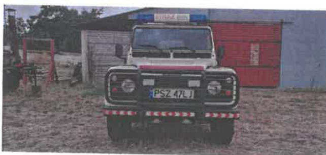
Dok. fot. nr 3