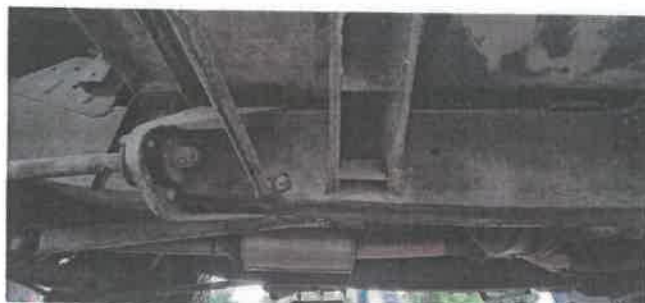
Dok. fot. nr 17