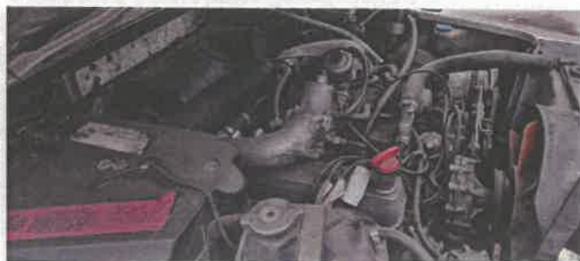
Dok. fot. nr 8