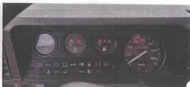
Dok. fot. nr 14