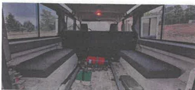
Dok. fot. nr 15