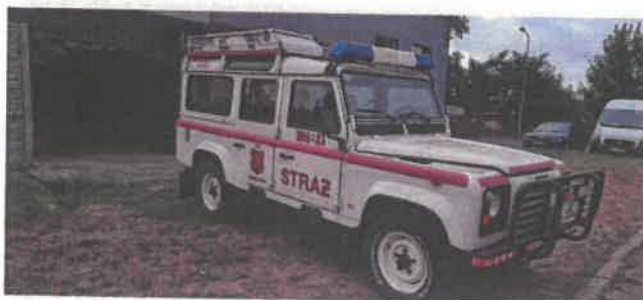
Dok. fot. nr 1