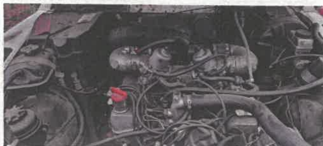
Dok. fot. nr 7