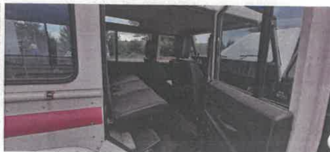
Dok. fot. nr 16