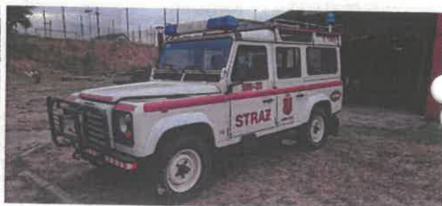
Dok. fot. nr 2