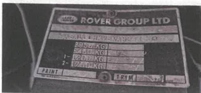
Dok. fot. nr 13