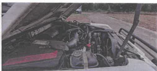
Dok. fot. nr 10